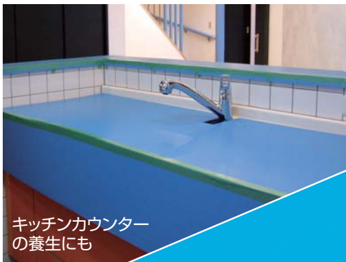
キッチンカウンターの養生にも