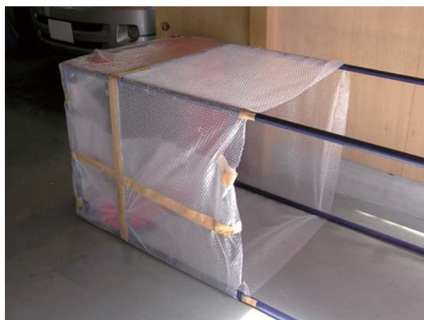
商品をソフトに包み込みます。