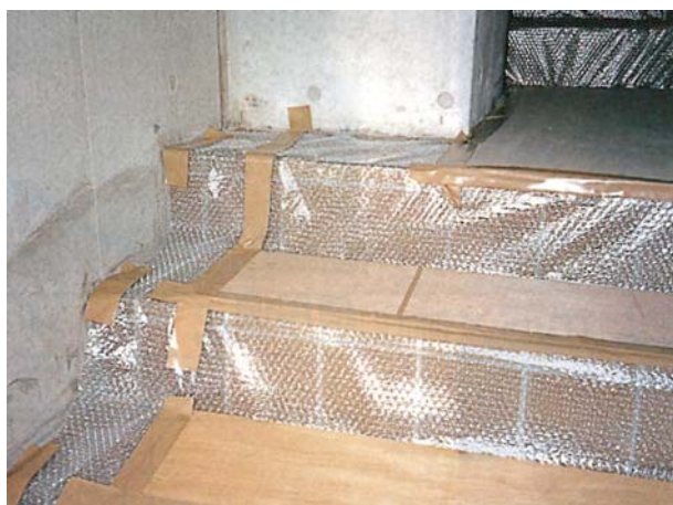
お馴染みの養生材です。